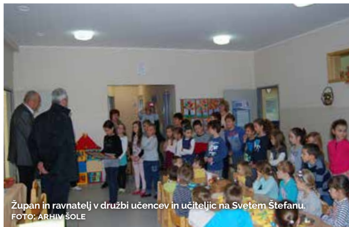
Župan in ravnatelj v družbi učencev in učiteljic na Svetem Štefanu.