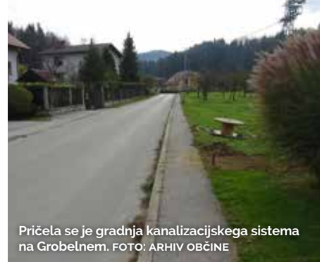
Pričela se je gradnja kanalizacijskega sistema na Grobelnem.

V začetku novembra je bila podpisana pogodba z izbranim izvajalcem gradbenih del za I. fazo gradnje kanalizacije in čistilne naprave Grobelno-Šentvid.