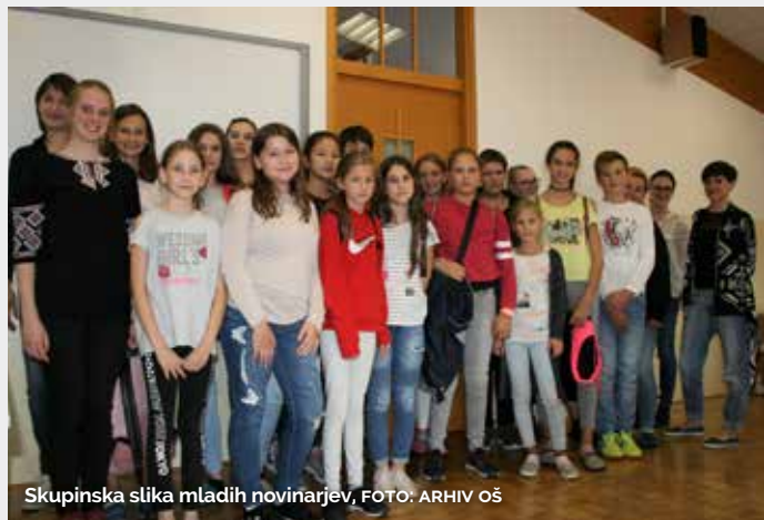
Skupinska slika mladih novinarjev

Fotografska razstava članov Foto kluba Šmarje je na ogled do prve polovice decembra v Skazovi hiši, prav tako načrtujejo fotografsko delavnico. Vse dodatne informacije dobite na e-naslovu fotoklubsmarje@gmail.com ali na FB profilu Foto klub Šmarje.