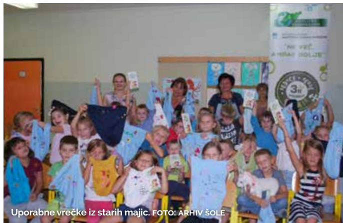
Uporabne vrečke iz starih majic.