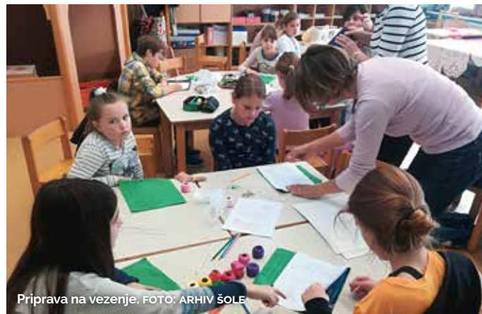
Priprava na vezenje.

V novembru so učenci pod vodstvom učiteljice in mojstrice ročnodelske umetnosti Stanke Vulevič spoznavali vezenje. Vezenje je del tradicije in kulture našega naroda in se je prenašalo iz roda