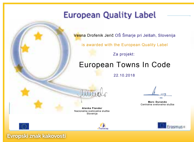
Evropski znak kakovosti