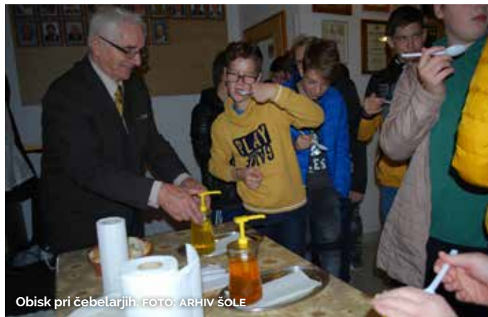
Obisk pri čebelarjih.

Naš namen je, da bi ozavestili otroke o pomenu zajtrka, prednostih lokalno pridelanih živil, pomenu samooskrbe, kmetijstva in